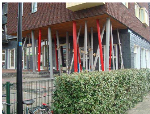
Zo was het

Vrijdag 18 maart zijn er tien vrijwilligers langs geweest om het palenbos op het buitenterrein te schilderen. Hier is gedurende een aantal maanden intensief overleg geweest tussen architect, De Key en BSO De Boomhut. Gekozen is om de grijze palen in geel, oranje en groen te verven. Enkele palen zijn van ander materiaal en verf. Hier horen wij nog welke verfsoort we kunnen gebruiken. Gelukkig is een van de vrijwilligers zelf schilder en is er een terugkomaafpraak gemaakt om de laatste afwerkingen/lagen te doen. Wij danken de lionsclub Zandvoort hartelijk voor de tijd en energie die erin is gestoken! De kinderen zijn erg blij met het vrolijke resultaat en wij ook!